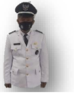
J E J E N KEPALA DESA CADASNGAMPAR