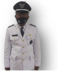
J E J E N KEPALA DESA CADASNGAMPAR